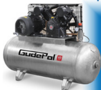
kompresor tłokowy HD